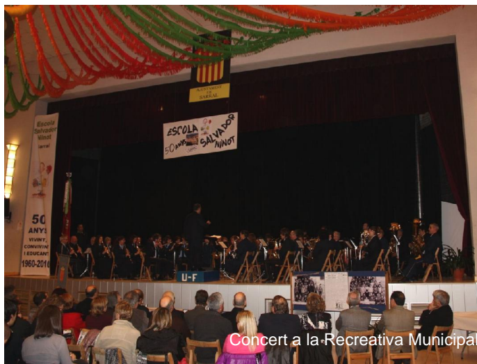
Concert a la Recreativa Municipal