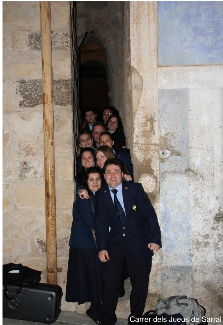
Carrer dels Jueus de Sarral