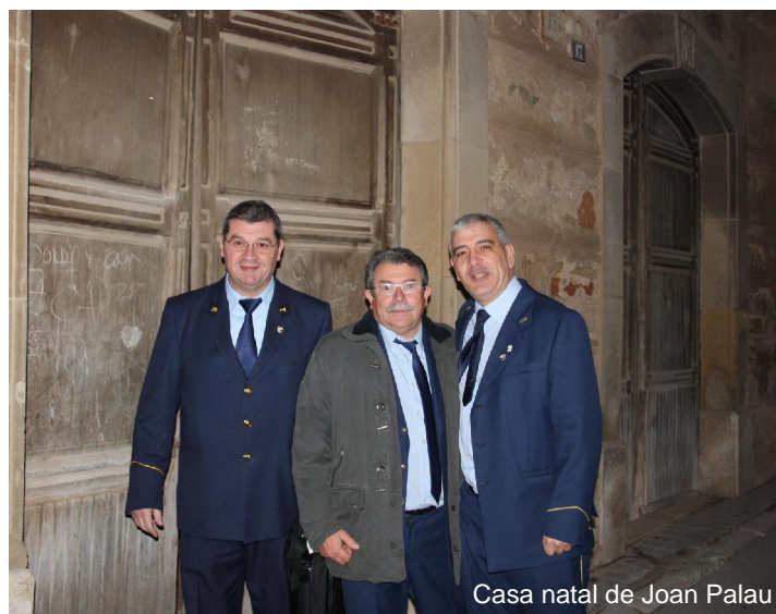
Casa natal de Joan Palau