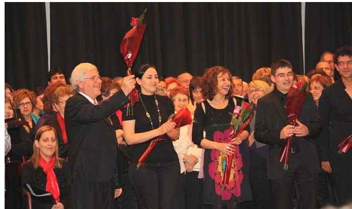
Els directors de les corals participants al final del concert