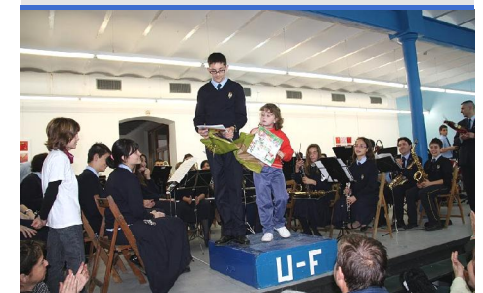
Entrega dels premis del Concurs de Dibuix