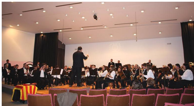
Concert de Sant Jordi 2010 a l'auditori de la Fila