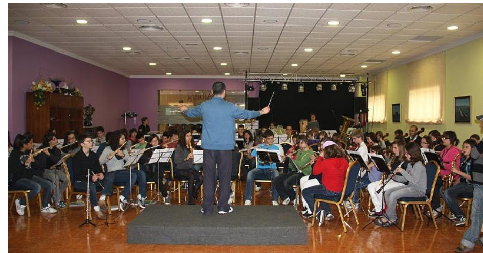
Un dels assajos al menjador de la Casa de Colònies L'Alberg

Encoratgem a tots els alumnes, al director i als professors de l'Escola de Música a continuar amb la seva tasca educativa que està donant tan bons resultats i els animem a organitzar activitats d'aquest tipus que serveixen per fomentar la convivència i l'intercanvi d'experiències utilitzant la música com a mitjà.