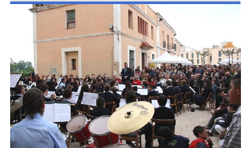
El concert va començar a la plaça del Castell