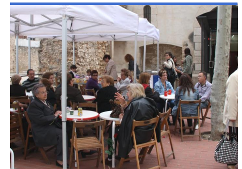
L'APIMA de l'Escola va ser l'encarregada del bar