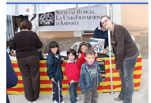
Els més petits van visitar la carpa de la Fila