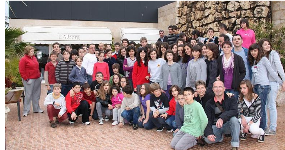
Foto de família