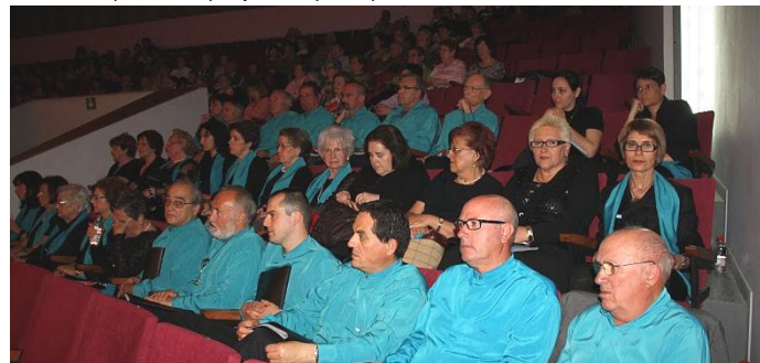
La Coral Aque esperant el seu torn