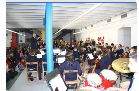
La pluja va fer canviar l'escenari del concert